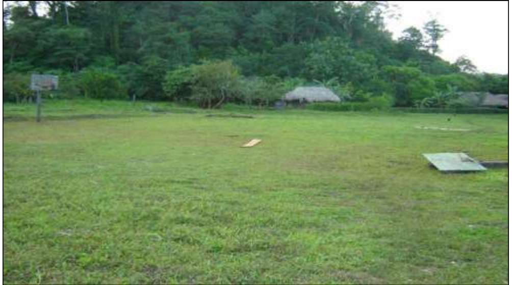
Comunidad Viejo Velasco

Antonio y Filemón eran una cobija que su madre les puso durante la retirada. Esa madre que en