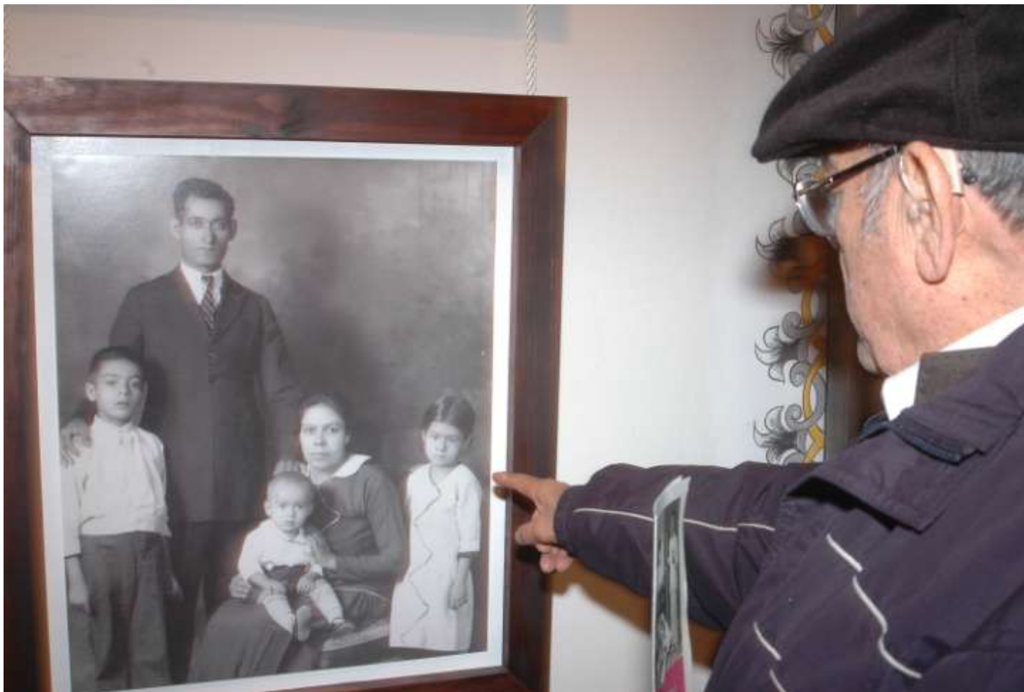
Centro Comunitario el "Caminante" Exposición de la vida de Don Samuel Ruíz García.

El Centro de Derechos Humanos Fray Bartolomé de Las Casas, A. C. es un organismo civil que trabaja en la promoción y defensa de Derechos Humanos cuyo trabajo se ubica en el estado de Chiapas. Nuestro compromiso es atender a la población excluida y organizada, en relación con el contexto de globalización. Nuestro aporte en la defensa de casos busca fortalecer la visión integral de Derechos Humanos.