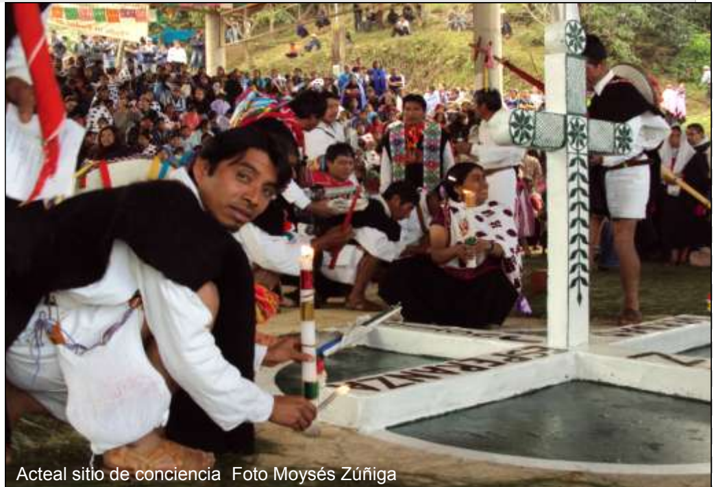
Acteal sitio de conciencia

“La masacre de Acteal es producto de la contrainsurgencia del estado y el Estado mexicano se empeña en negarlo”