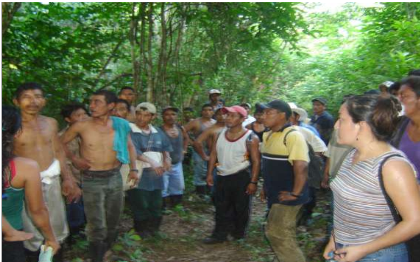
Desplazados de Viejo Velasco