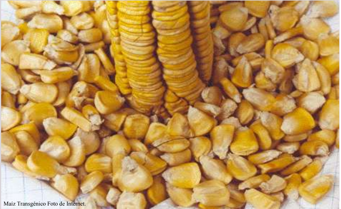
Maíz Transgénico

Por que somos pueblos del maíz no podemos permitir que se lo apropien un grupo de empresas transnacionales.