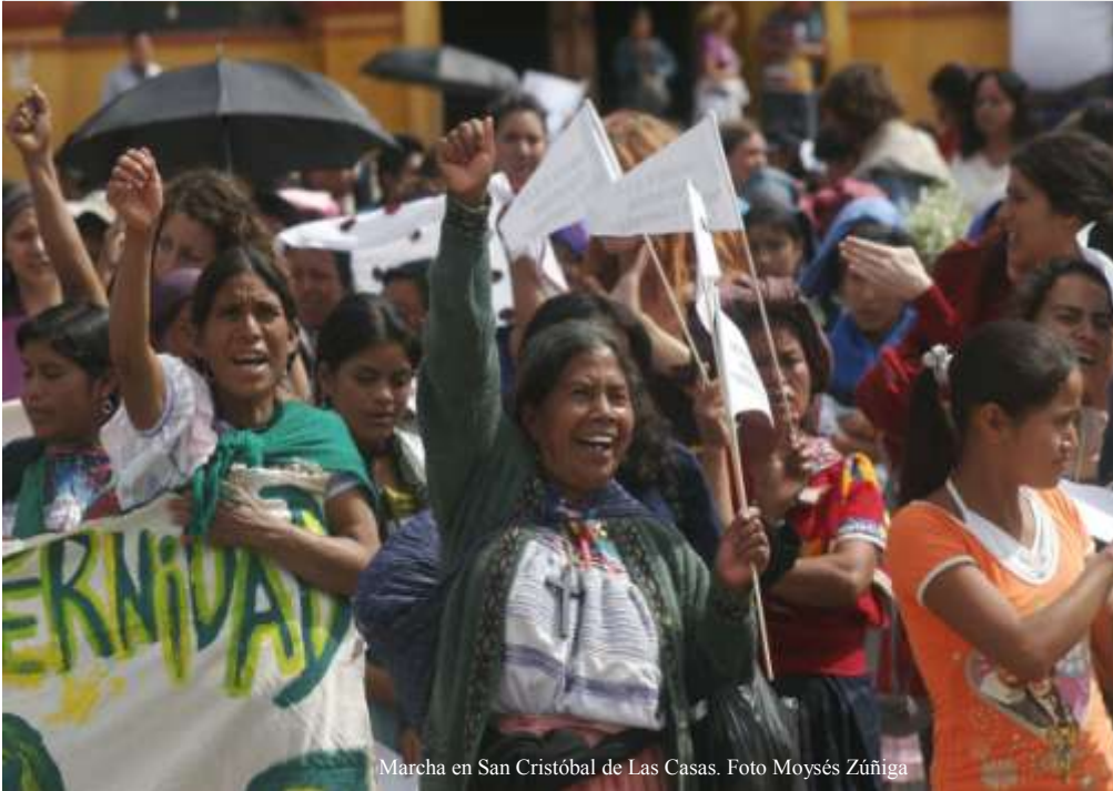
Marcha en San Cristóbal de Las Casas.

“Toda mujer tiene derecho a una vida libre de violencia, tanto en el ámbito público como privado.”