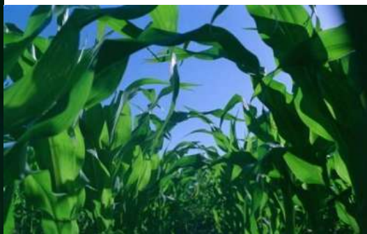
Matas de maíz