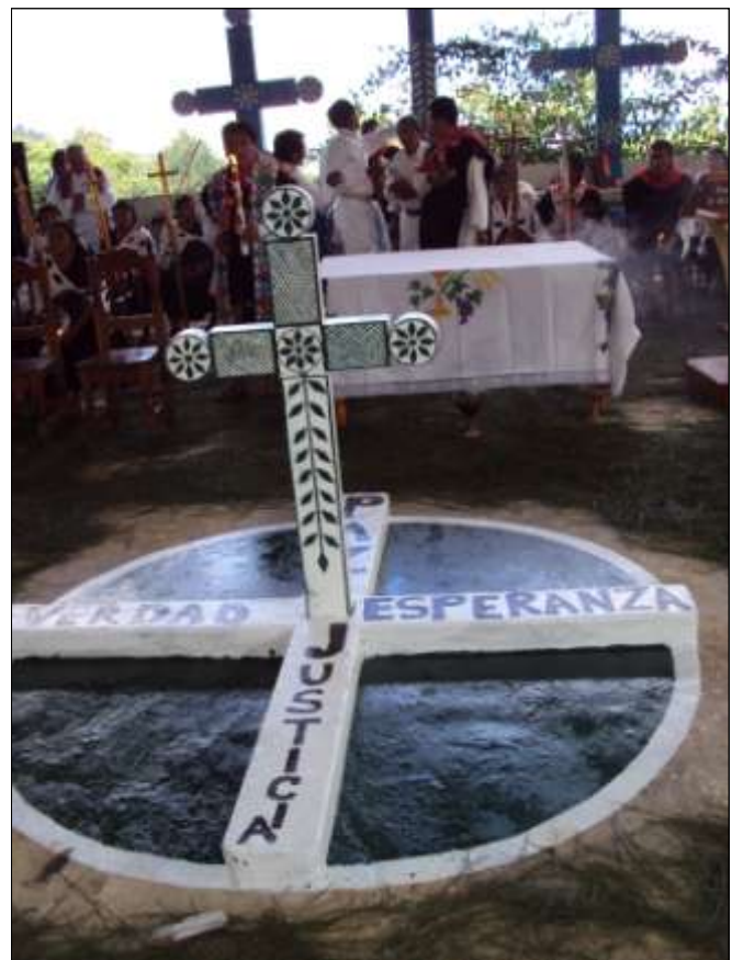
En este lugar se recuerda que el camino es largo aún.

Ex integrante del Centro de Derechos Humanos Fray Bartolomé de Las Casas y ex representante legal de las víctimas de la masacre.